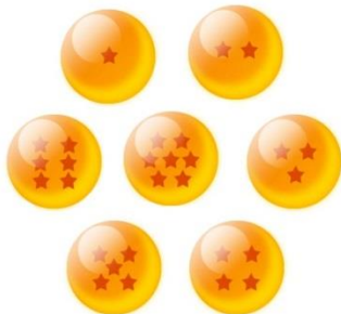
Figura 1. Esferas do dragão.

Usando o radar, você deve reunir as esferas do dragão o mais rápido possível!”