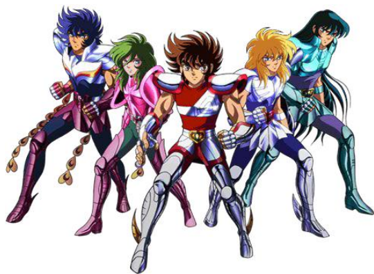
Figura 1. Os Cavaleiros de Bronze.

O seu objetivo é ajudar Seiya, Shiryu, Hyoga, Shun e Ikki a passar pelas 12 Casas do Zodíaco, derrotando todos os Cavaleiros de Ouro e salvando Atena o mais rápido possível!”.