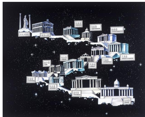
Figura 2. As 12 Casas do Zodíaco.

O Trabalho 1 consiste em implementar um agente capaz de guiar autonomamente Seiya, Shiryu, Hyoga, Shun e Ikki pelas 12 Casas do Zodíaco, planejando a melhor forma de derrotar os 12 Cavaleiros de Ouro e salvar Atena. Para isso, você deve utilizar o algoritmo de busca heurística A* .